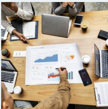
新規の FDI（海外直接投