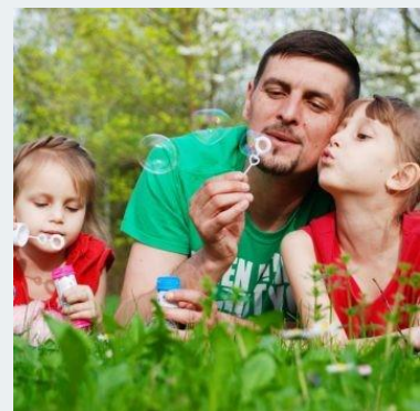
2018 年の「エクスパット・イ