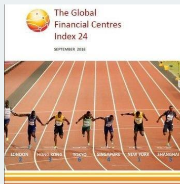
ルクセンブルク、EU の金融